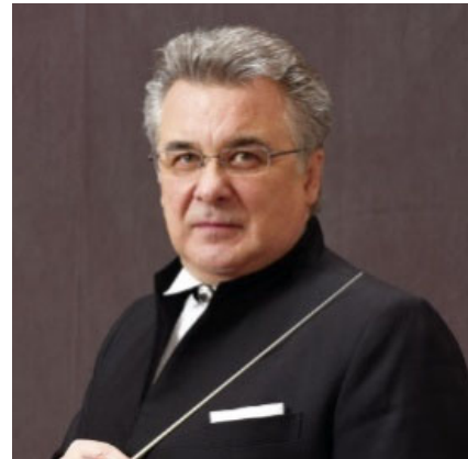
M.ジャジューラ(指揮)