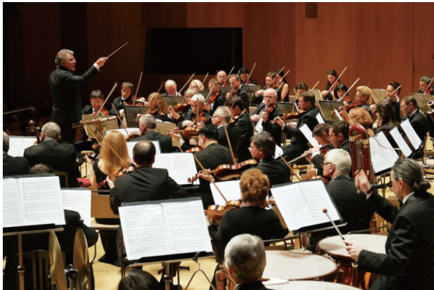
ウクライナ国立歌劇場管弦楽団