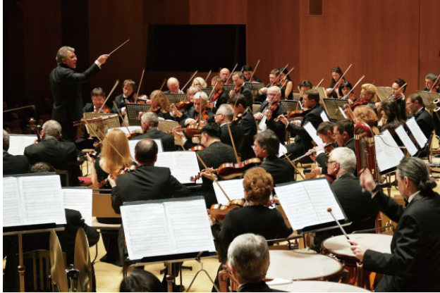
ウクライナ国立歌劇場管弦楽団