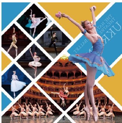
「スペシャル・セレクション 2023」