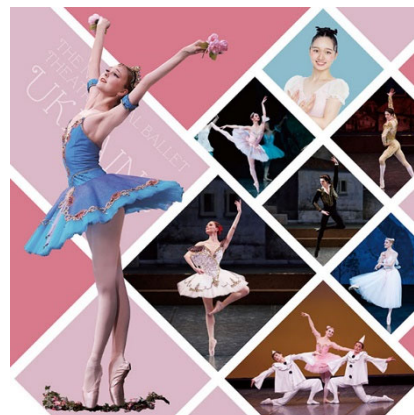
「親子で楽しむ夏休みバレエまつり」