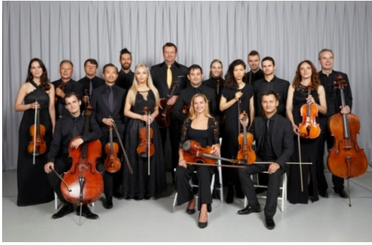
ウィーン弦楽合奏団